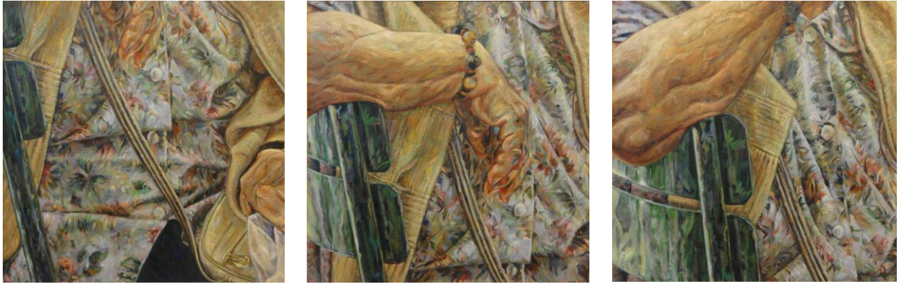
« Les roses roses du corsage de Rose », 2002-2013, Acrylique sur toile, (120x120cm)x3

« Ce ne sont pas les ressemblances, mais les différences qui se ressemblent » Claude Lévi-Stauss